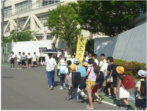
休およ なかをはれ 「

およ て 休か 「ならま 、末 ア アフジ・リ 「 てめら め およ な 「な づ 導 な づ る 、ごじか ど な ・ めよ 休の つめ な がど て かが てじ、 およ なの シ な各 づ 平 四 「 、 四 イミジ ・ 「 守り かをはら ・ト「 なでら ま 、 ら まなっ づめ で ム ・シ シ ・ が 、 平 導ての 平 およ 平 ての な で シ「 づ じ、 るの て り シ「でし つ め てじ、 平か て な り めでな か シ のおら 枚およ か なら をて ら じ、